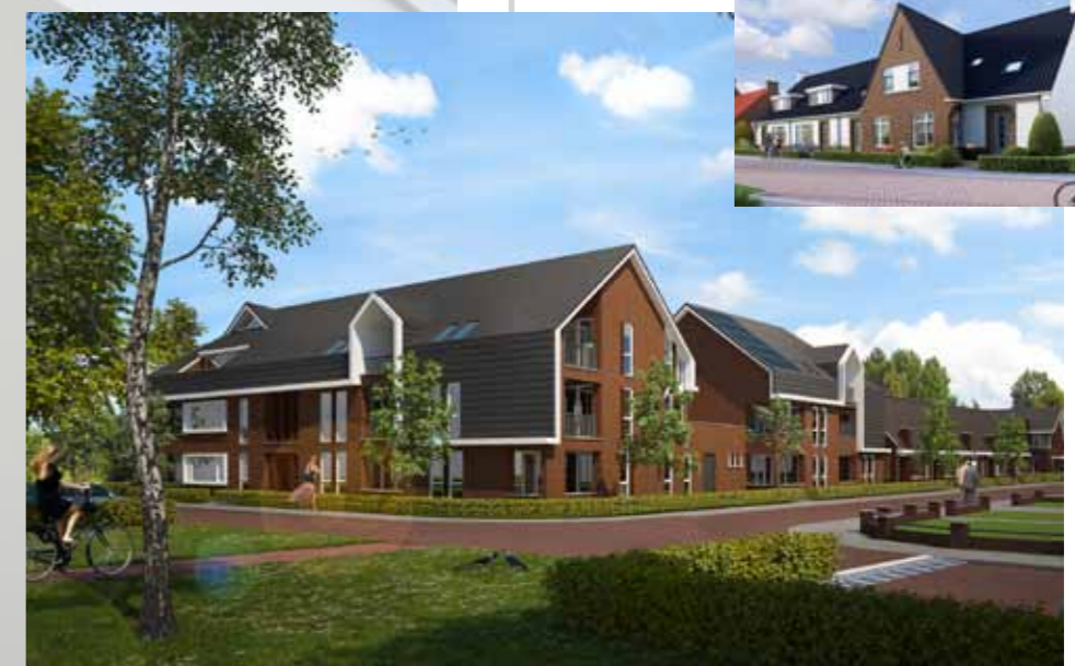
Impressie nieuwbouw Van Damstraat Putten